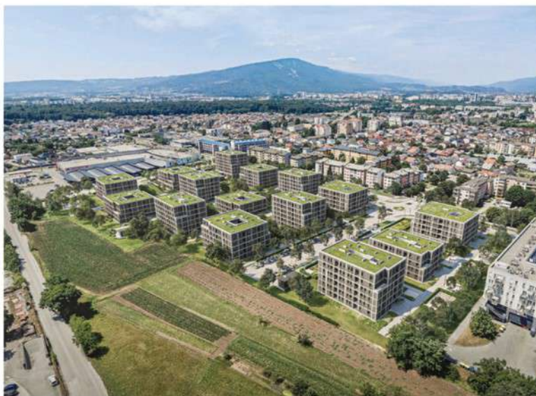
STANOVANJSKI SKLAD RS

Soseska Novo Pobrežje bo zgrajena na nepozidanem zemljišču ob Ulici Veljka Vlahovića. Na severni strani območje omejuje stanovanjsko-poslovni objekt s trgovinami, na zahodu Ulica Veljka Vlahovića, na jugu trgovski center, na vzhodu pa odprte kmetijske površine. Projektna rešitev je bila izbrana na javnem natečaju, na podlagi izbrane idejne zasnove pa je Mestna občina Maribor leta 2022 sprejela občinski podrobni prostorski načrt. Sosesko bo sestavljalo 15 večstanovanjskih