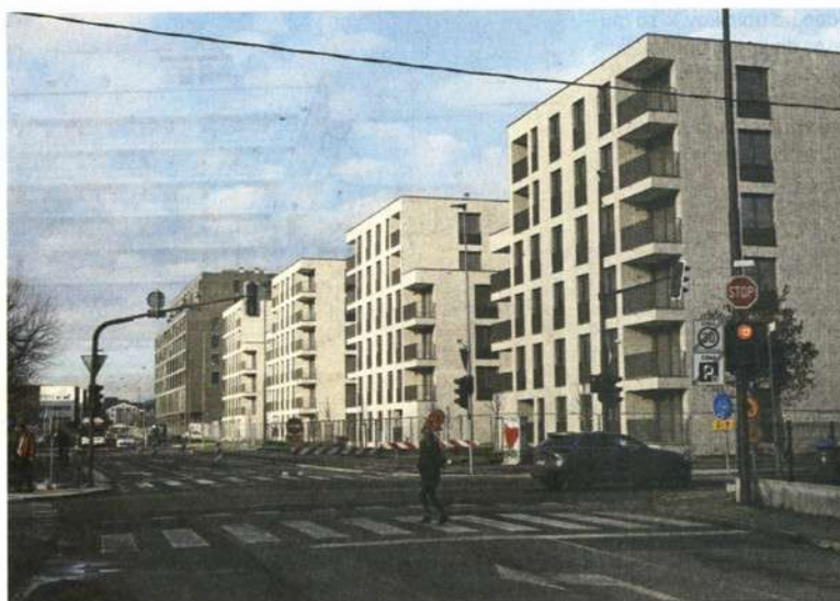
Ob pomanjkanju javnih najemnih stanovanj prebivalcem brez lastniškega stanovanja preostane tržni najem. Zaradi pomanjkanja ustreznih ponudbe, še posebej v Ljubljani, so cene visoke, vpogled v dejanske razmere slab.

Kaj bi morala storiti vlada, da bi neprofitna najemniška stanovanjska gradnja doživela dodaten pospešek, ki bi zmogel slediti raz-