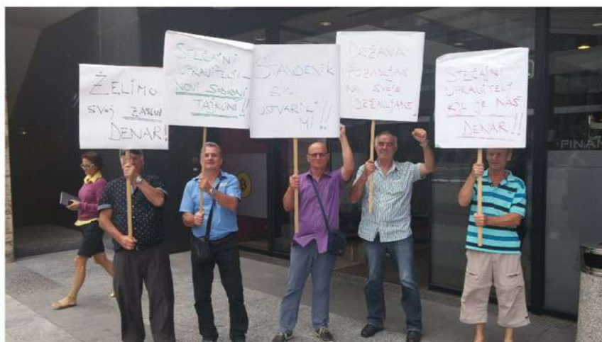
Stečaj vleče že skoraj desetletje in pol, delavci pa še čakajo na del svojega denarja.

Z verižnimi stečaji slovenskih gradbenih podjetij je bila le v nekaj letih na kolenih slovenska gradbena panoga. Začelo se je z Vegradom leta 2010, naslednje leto SCT-jem, leto pozneje pa s Primorjem, Kraškim zidarjem in Stavbenikom.