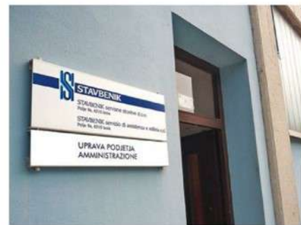
Podjetje je šlo v stečaj leta 2012.

Obalna sindikalna organizacija KS 90 je ves čas opozarjala na nesprejemljivo prakso, da delavci v Sloveniji skoraj desetletje čakajo na plačilo za opravljeno delo. Pozivala je k