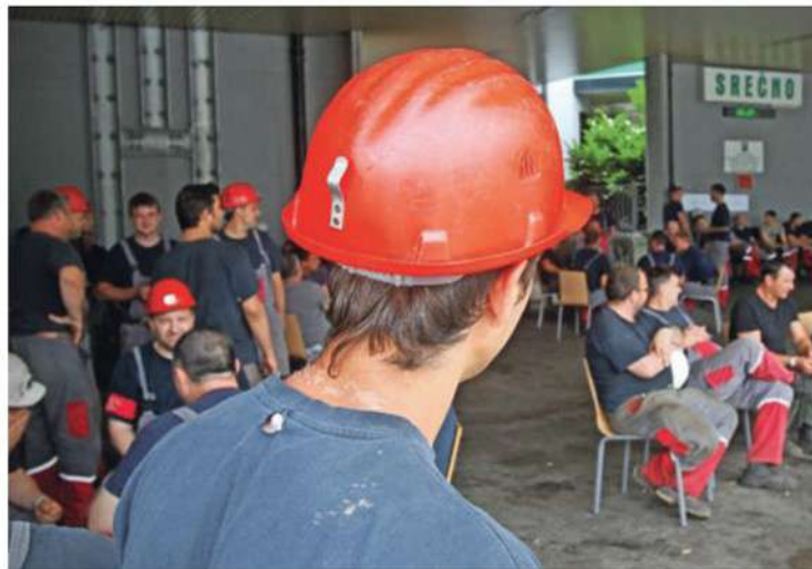
V stanovanjih Premogovnika Velenje živijo večinoma zaposleni ali nekdanji zaposleni v tem podjetju.